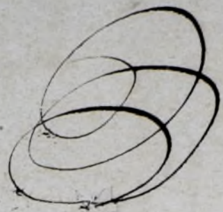
Tabella Anni 1702.